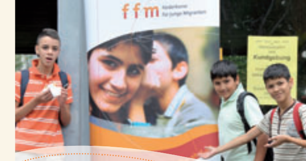
ffm-Auftaktveranstaltung 21.08.2008, Eduard-Spranger-Schule Frankfurt

Nur Dank Ihres Stipendiums habe ich es geschafft, das Studium mit meinen kleinen Sohn abzuschließen. Ich danke Ihnen recht herzlich für die Schnelligkeit, mit der Sie reagiert haben und auch für die Freundlichkeit bei allen Anfragen! Ihre Stiftung hat mir sehr geholfen, meine Zukunft zu verbessern, und wenn ich eines Tages zu den gut verdienenden Menschen gehöre, bin ich ganz bestimmt ein Spender von Ihnen.