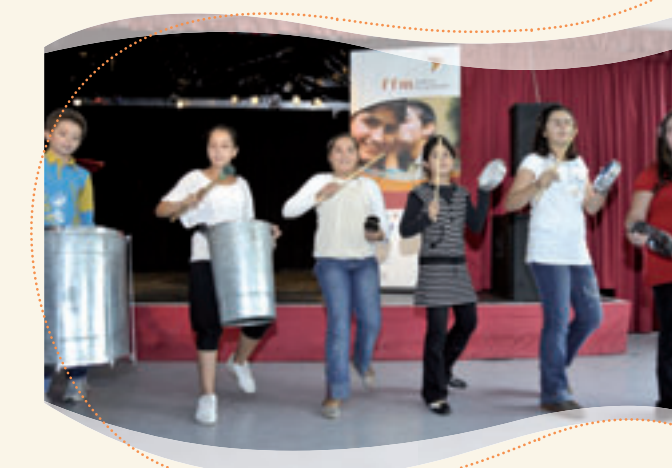
ffm-Auftaktveranstaltung 21.08.2008, Eduard-Spranger-Schule Frankfurt